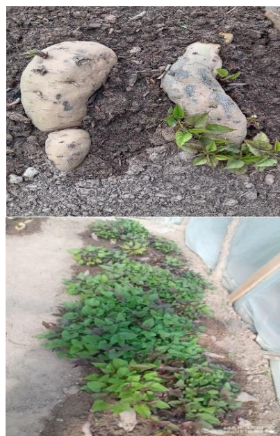
1-rasm. Batat tuganak mevalarining unib chiqishi.

1-rasmda ko’rsatilganidek, tuganaklardan olingan ko’chatlar zich, to’q yashil bargli va bixil rivojlangan bo’lib, bu amalga oshirilgan tadbirlarning samaradorligini isbotlaydi. Shuningdek, issiqxona mikroklimate (namlik va harorat) tuganaklarning tez unib chiqishini ta’minlab, ko’chat sifatini sezilarli darajada yaxshiladi.