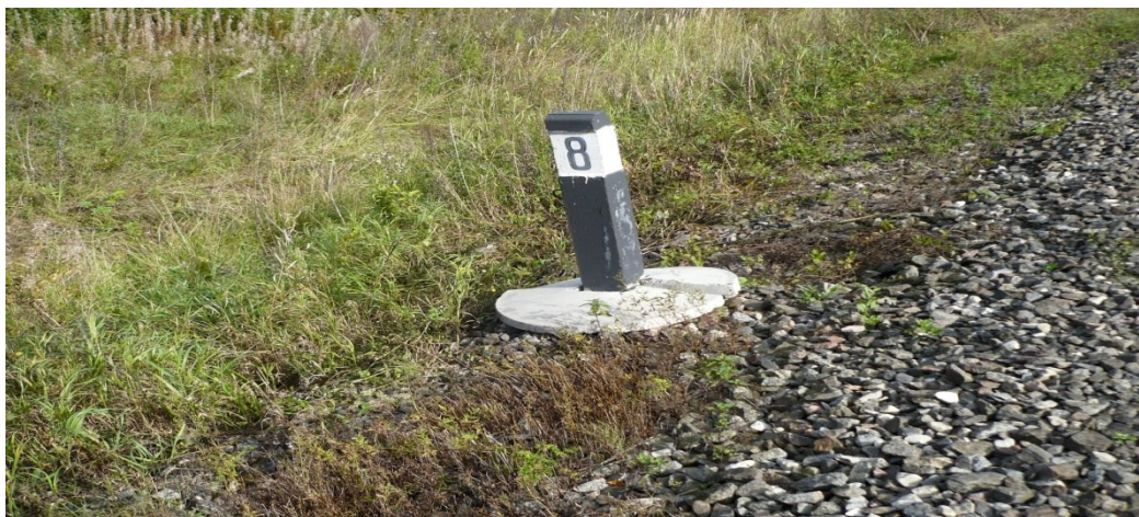
4-rasm. Joyga o'rnatilgan opoznak nuqtalar

Tayyorgarlik ishlarni olib borishda, loyihalashda va loyihani joyga ko'chirishda aniqligini oshirish uchun joyda mahkamlangan, aniqlangan (opoznak) nuqtalaridan foydalaniladi (4-rasm).