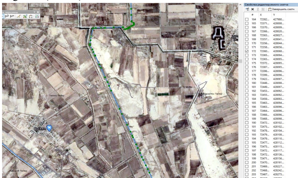
3-rasm. Loyiha nuqtalarini o'rnatish

Loyiha nuqtalarni joyga ko'chirish usullari bilan birgalikda, qachonki loyiha nuqta ishonch bilan tanlanalingan konturli nuqta bilan mos keladi va joyda o'lchashlarni bajarish talab qilinmaydi, yoki qachonki AB kontur chizig'ida C loyiha nuqtaning o'rni (3-rasm).