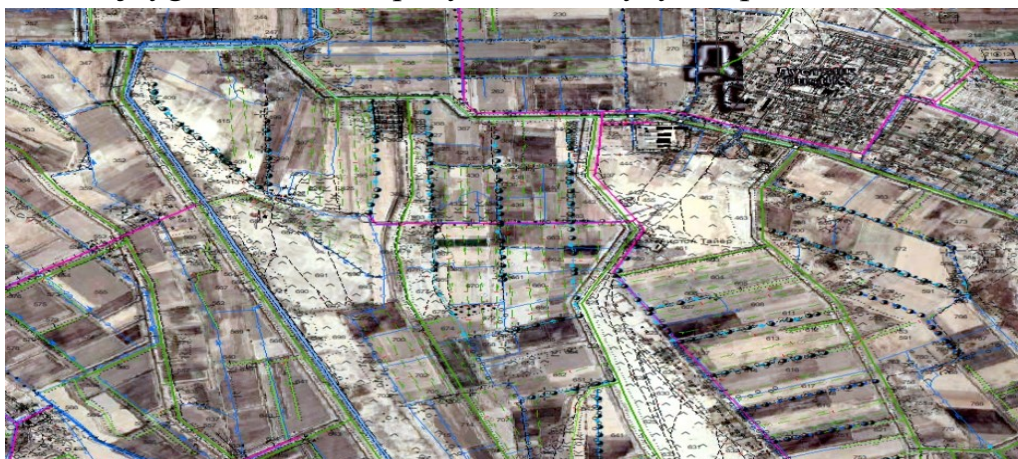
2-rasm. Kosmosuratlarni deshifrlash

Deshifrlash belgilarni tushirishi bilan aerosuratlardagi tafsilotlar qisman yopiladi va konturli nuqtalarni tayanch sifatida qo'llanishi ko'p miqdorda kamayadi. Shuning uchun loyihalashda, ayniqsa loyihani joyga ko'chirishda, loyihalashni bajariladigan deshifrlangan aerofoto-mahsulotlardan tashqari, ular yordamida ko'p miqdorda joydagi mayda ob'ektlarni osongina tanlab olishiga imkon beradigan deshifrlanmagan kontaktli aerosuratlarni mavjudligi foydali hisoblanadi. Ular bilan tomonlar parallelligi va perpendikulyarligini qattiq rioya qilishini talab qilinmaydigan uchastkalarni joyga ko'chirishi qulay, masalan, yaylov, pichanzorlar va h.k. (2-rasm).