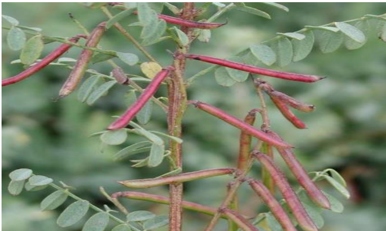
1-rasm. Indigofera tinctoria L. O'simlik guli va dukkaklari.

O'zbekiston sharoitida iqlimning issiq va qurg'oqchilikka chidamli bo'lishi indigoferina uchun qulay muhit yaratadi. Mamlakatda bu o'simlikni yetishtirish nafaqat sanoat sohasi uchun tabiiy bo'yoq xom ashyosini ta'minlaydi, balki oziq-ovqat xavfsizligini kuchaytirish, organik qishloq xo'jaligiga o'tish va "yashil iqtisodiyot" strategiyasini amalga oshirishga ham xizmat qiladi [8, 9].