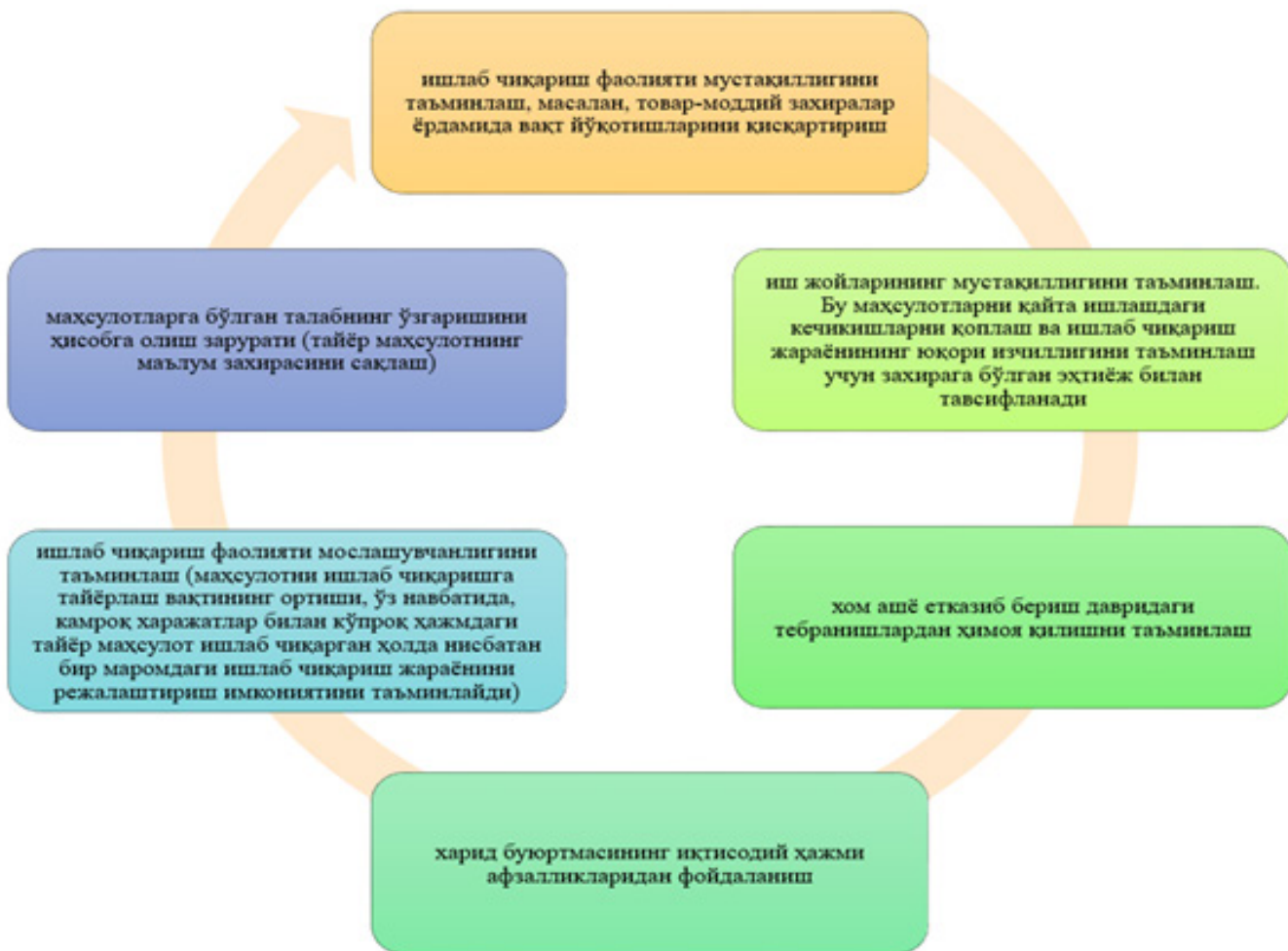
3-расм. Товар-моддий захираларни бошқариш йўналишлари

Хўжалик юритувчи субъектларда товар-моддий захиралар ҳисобининг тўғрилигини ва ҳаққонийлик даражасини ошириш бўйича асосий тадбирлардан бири бу мазкур хўжалик юритувчи субъектларнинг хусусиятларини, товар-моддий захираларни ҳисобдан чиқариш, қабул қилиш ва улардан фойдаланиш вақтида қўлланиладиган усулларни тўғри ҳамда норматив-ҳуқуқий ҳужжатларга мувофиқ ҳолда бажариш зарур. Шунингдек, товар-моддий захиралар билан боғлиқ жараёнларни тартибга солишда юқори малакали мутахассислар билан ички назоратни амалга ошириш мақсадга мувофиқдир.