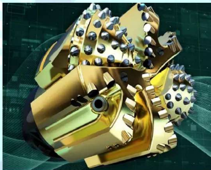
2 – rasm. Gibril burg`ilarning ko`rinishlari.

Baker Hughes kompaniyasining gibril burg'ilash texnologiyasi eng murakkab sharoitlarda burg'ilash vaqtini va tushirish – ko`tarish ishlarini qisqartirish uchun sharoshkali va polikristal olmosli ixcham (PDC) qattiq burg`ilarni yagona, patentlangan konstruksiyasini birlashtiradi. Sharoshkali burg`ilarining mustahkamligi va barqarorligi, shuningdek, olmos burg`ilarning keskirliги va uzluksiz ishlashi natijasida burg`ilab o`tish tezligini oshiradi, ushbu texnologiya quduq tubini shlamdan tozalashni oshiradi. [1].