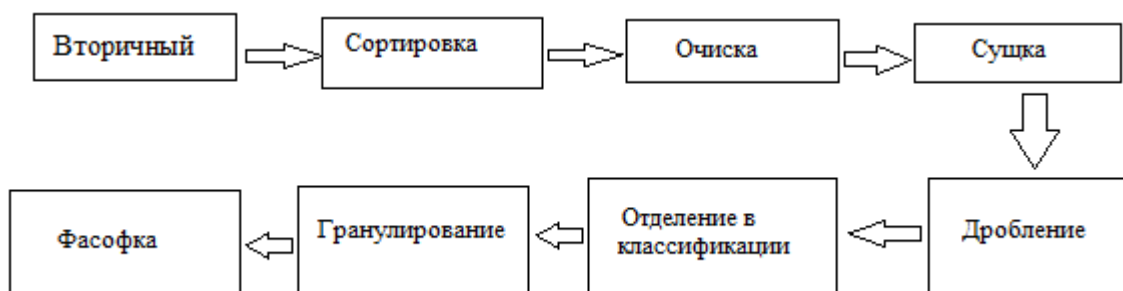
Рисунок 1. Блок-схема технологического процесса подготовки и переработки отходов полиэтилена

экологически безопасен. Кроме того, переработка создает возможности для экономии ресурсов. Переработка ПЭ регламентирована нормативными документами, в частности ГОСТ Р 54533-2011, ГОСТ 33573-2015. Технология переработки отходов полимерных материалов включает несколько последовательных стадий: сортировку, дробление, разделение смешанных отходов, промывку, сушку. После этого материал переносится на гранулу. Блок-схема технологического процесса подготовки и переработки отходов полиэтилена представлена на рис. 1.