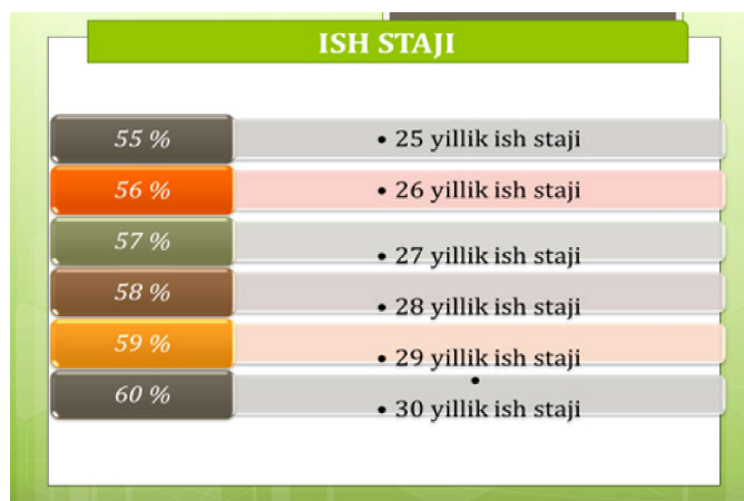
3-rasm. O'zbekistonda yoshga doir pensiya tayinlashda ish stajiga nisbatan o'rtacha ish haqi bog'liqligi