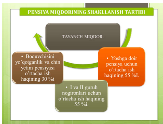
4-rasm. O'zbekistonda pensiya miqdorining shakllantirish tartibi

Fuqarolarga pensiya tayinlash uchun yetishmayotgan har bir oyi uchun bir martalik sug'urta badallarini to'lash asosida (5 yildan ortiq bo'lmagan davr uchun) ish stajini sotib olish amaliyotini joriy etilishi ularning munosib miqdordagi pensiya olishlari hamda Moliya vazirligi huzuridagi budjetdan tashqari Pensiya jamg'armasining qo'shimcha tushumlarining shakllanishiga olib keladi.