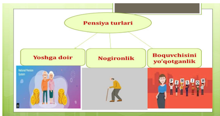
1-rasm. Pensiya turlari

Ijtimoiy himoya nazariyasini yaratishdagi yirik ishlardan birini olimlardan L.Ryustov, V.Ryopke, F.Byole, V.Oyken va G.Grossman-Dertlar XX asrning 30-yillari oxirida amalga oshiradilar. Ular “Ijtimoiy bozor xo’jaligi” nazariyasini ishlab chiqib, jamiyat iqtisodiy hayotidagi yutuqlarga fuqarolarning ijtimoiy