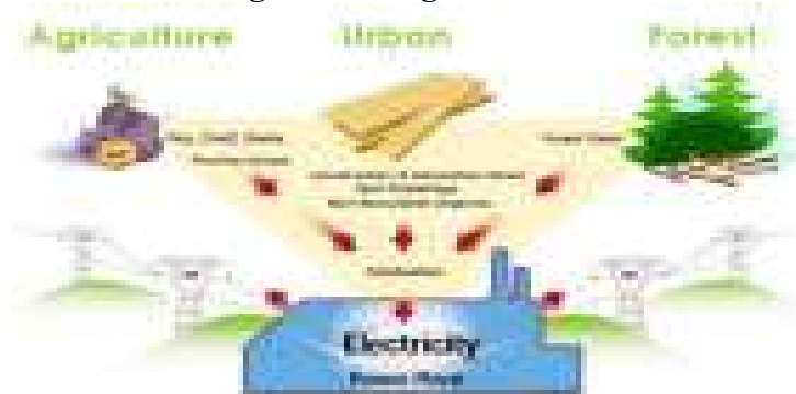
Figure3. Using of biomass

Biomass —renewable energy from plants and animals. Solid biomass. Biomass is the material derived from recently living organisms , which includes plants, animals and their byproducts. Manure, garden waste and crop residues are all sources of biomass. It is a renewable energy source based on the carbon cycle , unlike other natural resources such as petroleum , coal , and nuclear fuels. Another source includes.