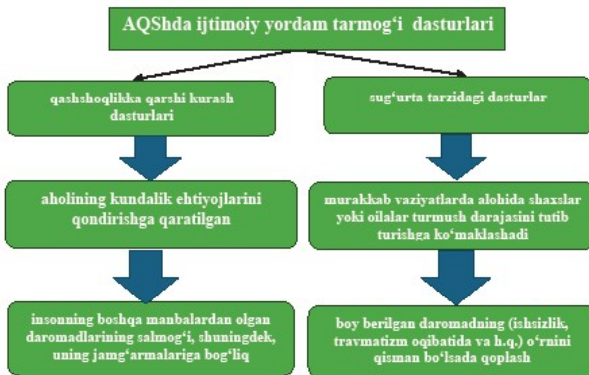
1-rasm. AQShda ijtimoiy yordam tarmog'i dasturlari [11]

Ijtimoiy himoya ijtimoiy-iqtisodiy munosabat sifatida jamiyat va aholi o'rtasidagi muhtojlik hollarida yordam, qariyalarga ko'maklashish, sog'liqni saqlash, ijtimoiy ahvolni yaxshilash, hayotiy zarur vositalar bilan ta'minlash kabi munosabatlar majmuasidan iboratdir. Ijtimoiy himoyaning subektlari - turli darajadagi qonunchilik va ijroiya hokimiyatlari, davlat va nodavlat sohalaridagi ish beruvchilar, kasaba uyushmalari, o'zini-o'zi boshqarish organlari kabi institutlardir. Ular davlat ijtimoiy siyosatini shakllantirish va ro'yobga chiqarilishida faol ishtirok etadilar. Obyekti esa - tegishli mamlakat aholisi. Bosh maqsadi - insonlarning ijtimoiy talab va ehtiyojlarini qondirish uchun munosib turmush tarzi, shart-shariotlarni yaratib berish, yordamga muhtoj alohida shaxslar va ijtimoiy guruhlarni qo'llab-quvvatlashdir. Zotan, aholining barcha qatlam va guruhlarining talab va ehtiyojlaridan kelib chiqib ijtimoiy himoya jamiyat hayotining barqarorligini, birdamligini, mo'tadilligini ta'minlaydi va barqaror ijtimoiy-ruhiy vaziyatni saqlab turadi.