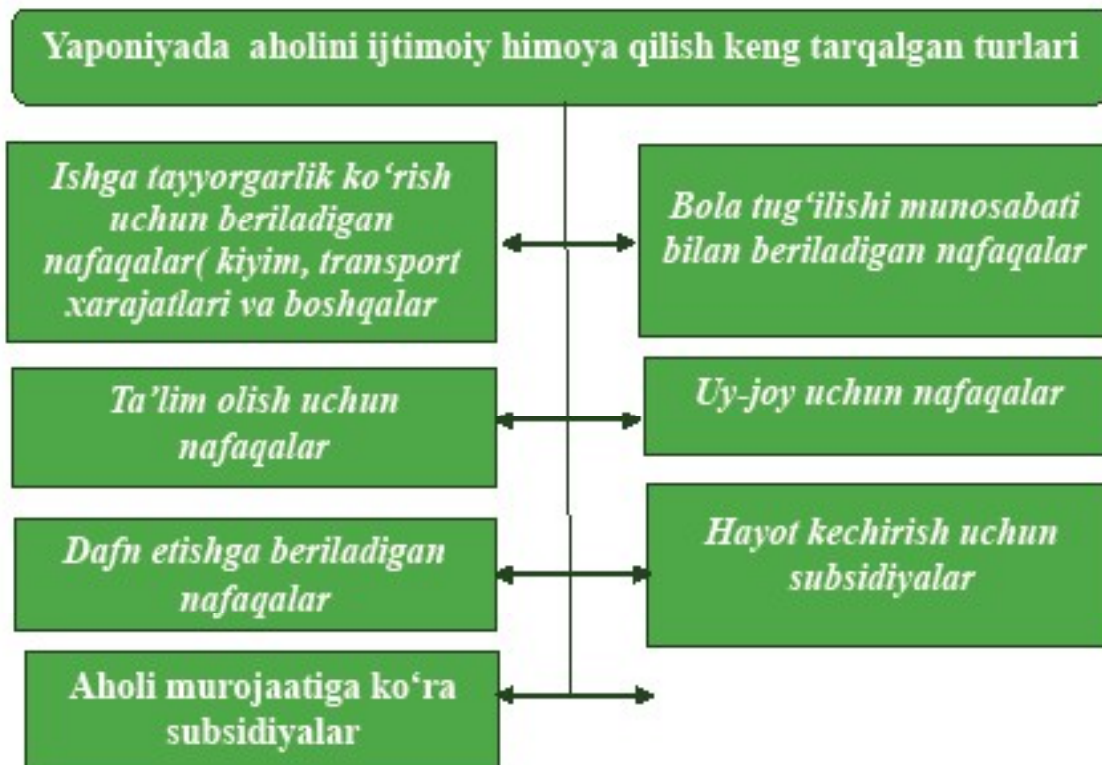
2-rasm. Yaponiyaning ijtimoiy himoya turlari [11]

Yaponiyada esa ijtimoiy himoya quyidagi 2-rasmda berilgan va ushbu davlatning ijtimoiy himoyasi aholining farovonligini ta'minlashga qaratilgan.