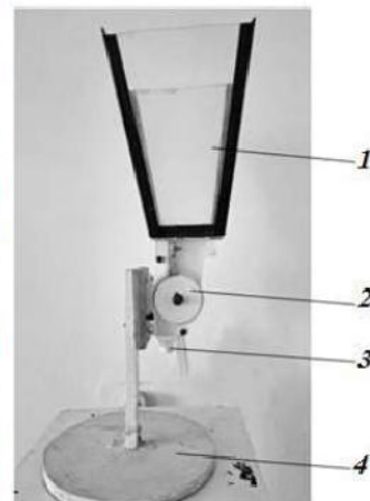
1- o‘g‘it solish bunkeri, 2- g‘altakli me‘yorlagich (novli g‘altak), 3- o‘g‘it tushish yo‘li, 4- mahkamlovchi asos.

Ushbu sinash qurilmasi o‘g‘it solish bunkeri 1,